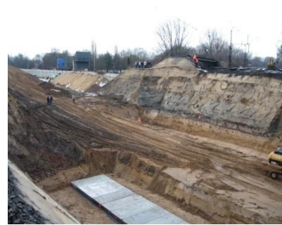
Plac budowy po zakończeniu pracy przez spycharko-ładowarki FRUTIGER.