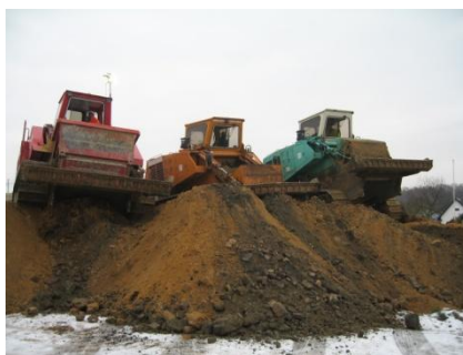
Składowanie nadkładu na oddalonym o 200 metrów składowisku.